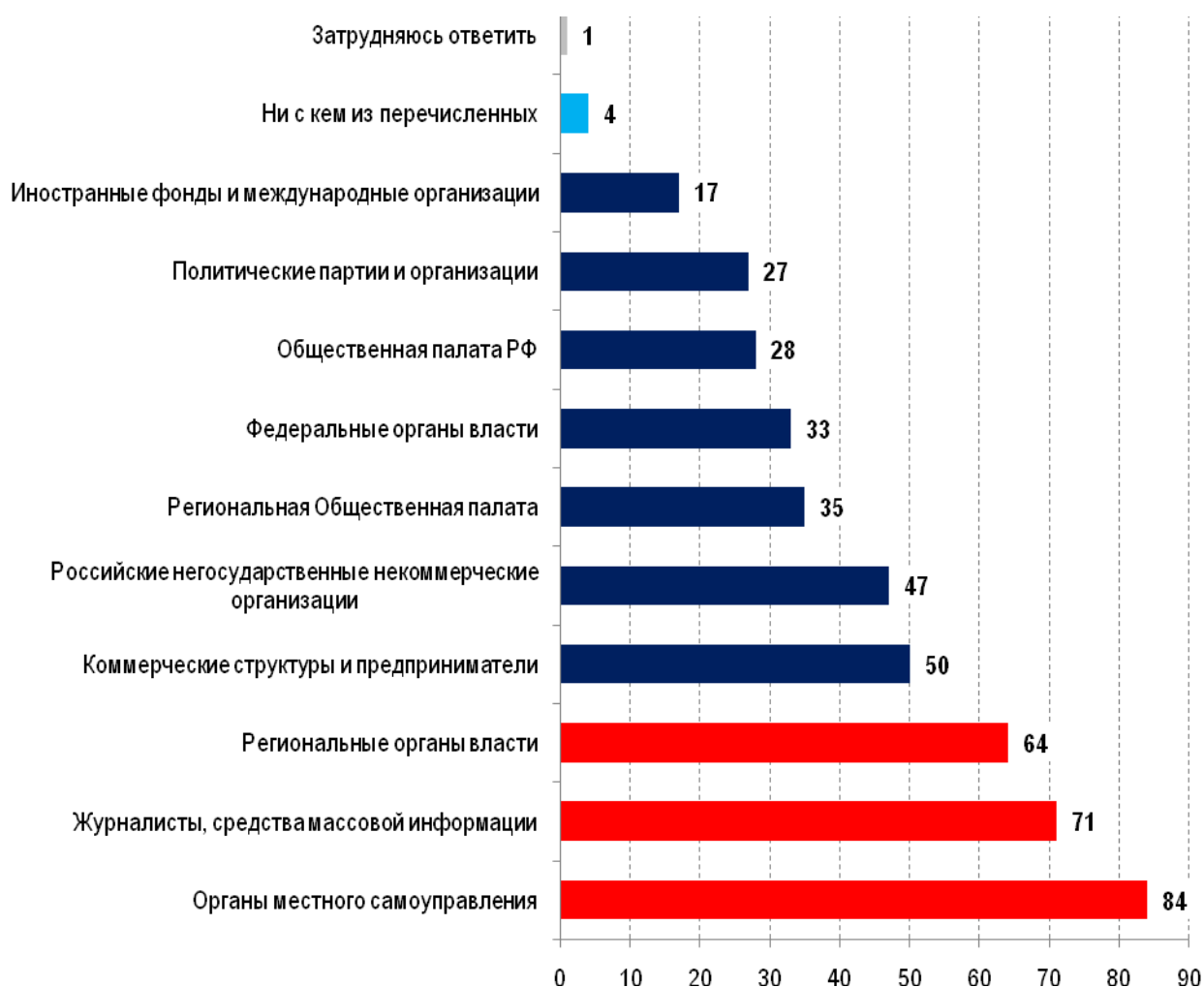
Рис. № 5.1.1. С какими из перечисленных на карточке субъектов взаимодействует Ваша организация (% от опрошенных, N=1032)

Среди НКО различной организационно-правовой формы и различных видов деятельности, результаты исследования фиксируют определенные различия. Несколько чаще взаимодействуют с органами местного самоуправления общественные организации (88%) и объединения юридических лиц (88%). Для этих двух форм организаций также характерно более активное взаимодействие со СМИ, журналистами (78% - общественные организации и 76% - объединения юридических лиц), с региональными органами власти (72% и 76% соответственно). Общественные организации более активно, чем НКО других организационно-правовых форм взаимодействуют с региональной Общественной палатой – 41%. В целом для общественных организаций характерно максимально высокий уровень взаимодействия с достаточно большим количеством субъектами: лишь 1% общественных организаций ни с кем не взаимодействует. Для сравнения отметим, что среди всех НКО доля таковых составляет 4%.