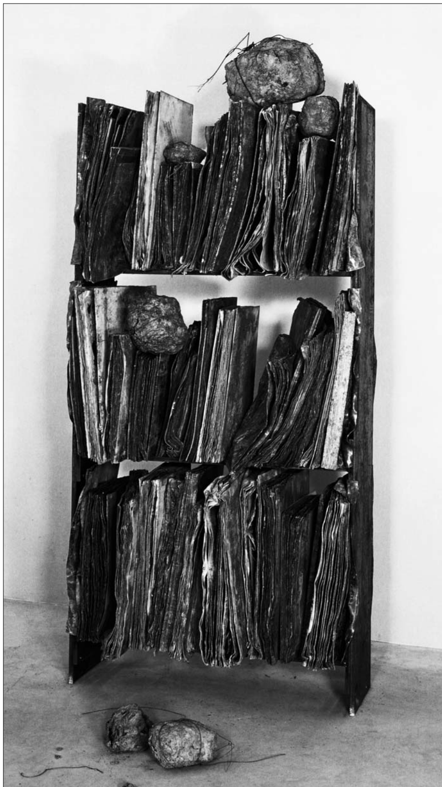
Ансельм Кифер. Библиотека. 1991