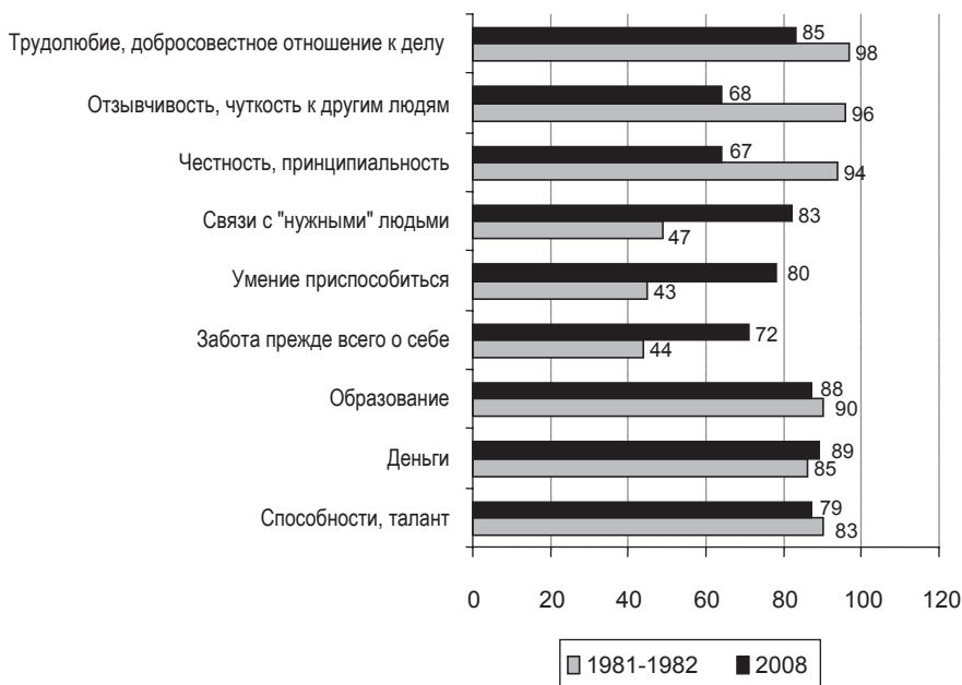
Рис. 3. Факторы достижения успеха и благополучия

(в доперестроечной и сегодняшней России; в % к числу опрошенных)