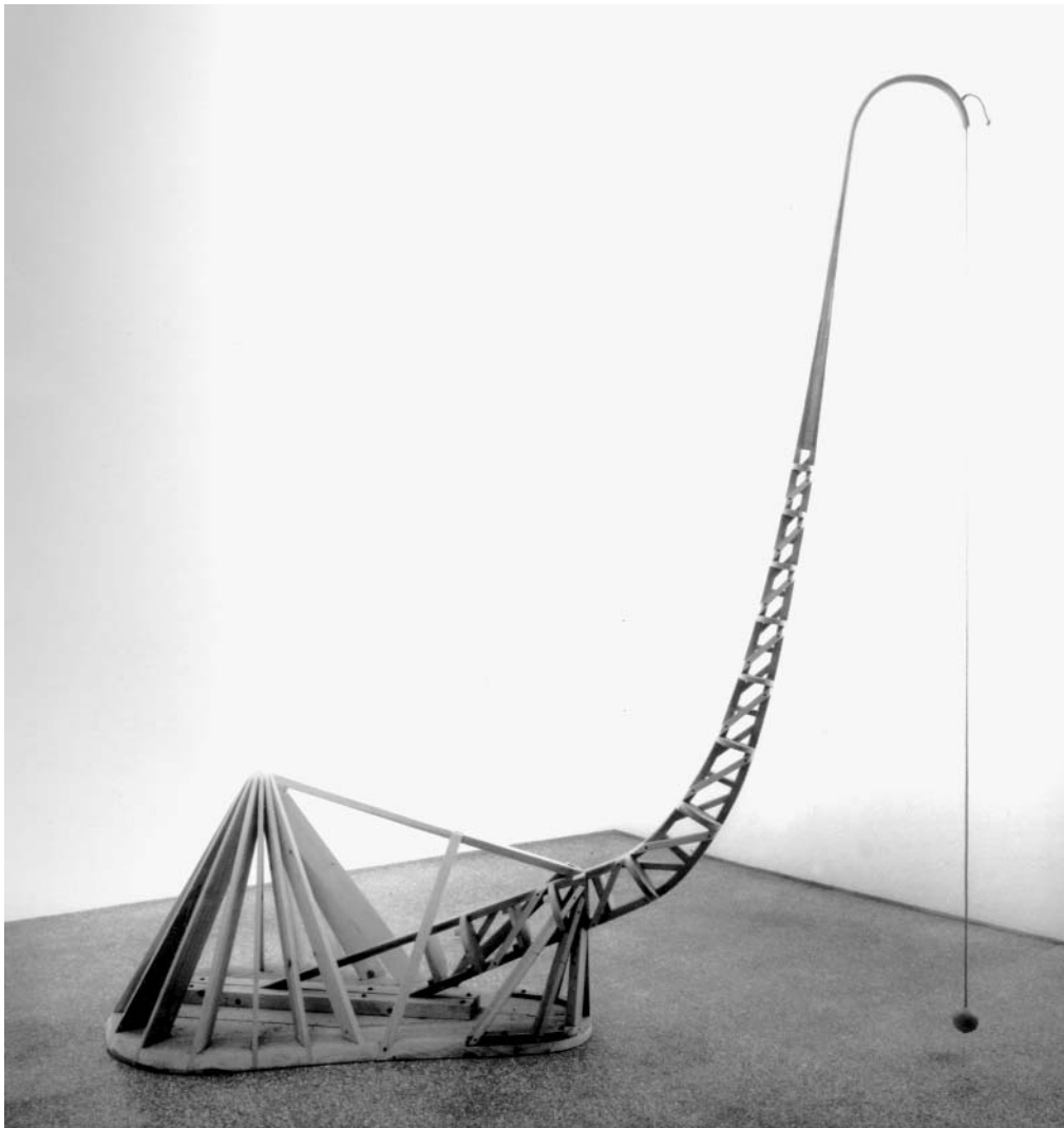
Мартин Пурийяр. Без названия. 1997–2001

рода неоднородна. Это набор разных норм, образов, кодов, которые могут не просто отличаться, но и противоречить друг другу, конфликтовать между собой. Различными сторонами одной и той же идентичности могут быть и доброта, и жестокость. Скажем, русские люди предпочитают считать себя скорее душевными, открытыми, готовыми помочь ближнему. Но вот читаю Дмитрия Мережковского: нам, русским «не надобен хлеб: мы друг друга едим и сыты бываем». Социумы похо-