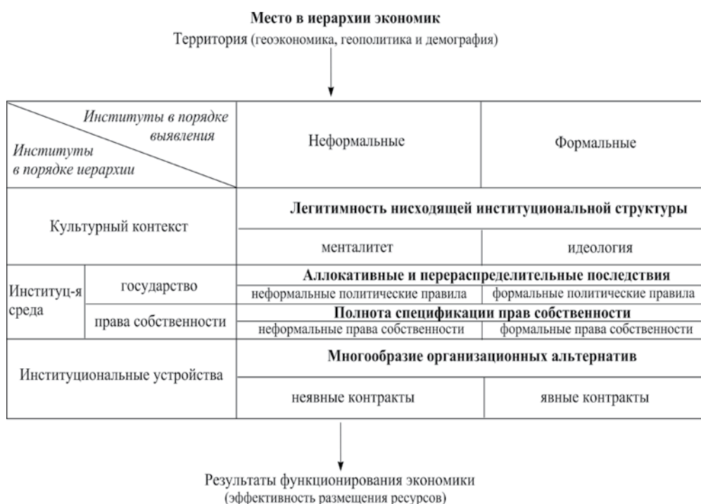
Рис. 1. Иерархия экономик и институциональная структура

Если в Москве, в противоположность российской периферии, будет относительно развит сектор услуг, рельефно будут выступать частная собственность и прочие прогрессивные институты, то в еще большей степени это касается центров национальных экономик, располагающихся ближе к центру мировой экономики – услуг и прав будет больше в Париже и еще больше в Нью-Йорке. Для определения места национальных экономик в иерархии сравнивать следует только сопоставимые по иерархии регионы. Нельзя сравнивать Нью-Йорк и даже Петербург, поскольку последний – все же не центр национальной экономики. Точно так же нельзя сравнивать бедные негритянские регионы Америки с Москвой.