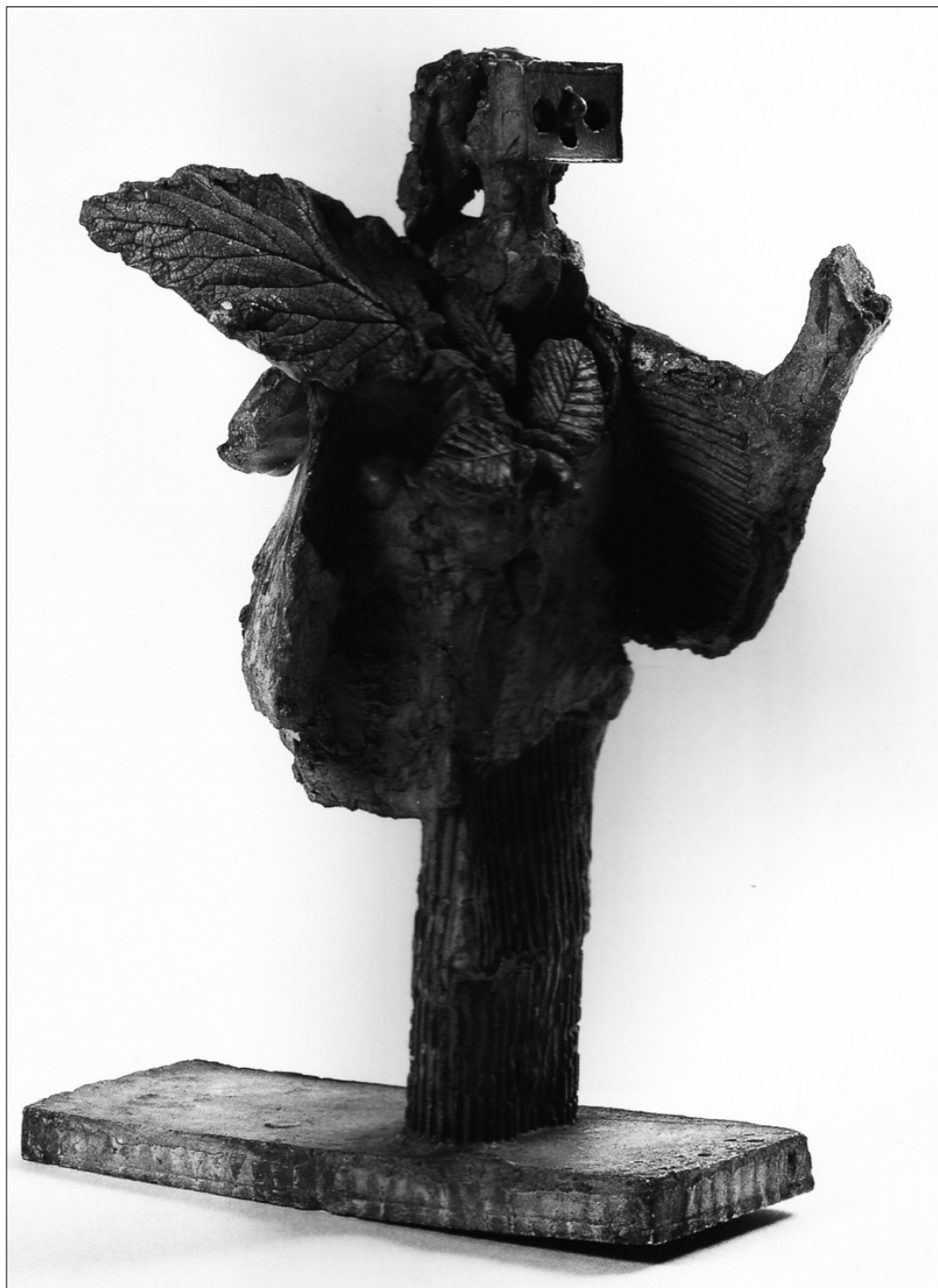
Пабло Пикассо. Женщина с листом. 1934