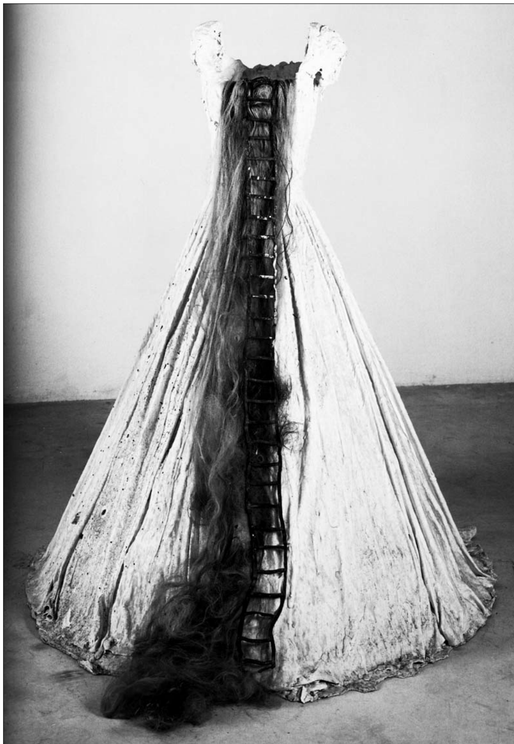
Ансельм Кифер. Рапунцель. 1999