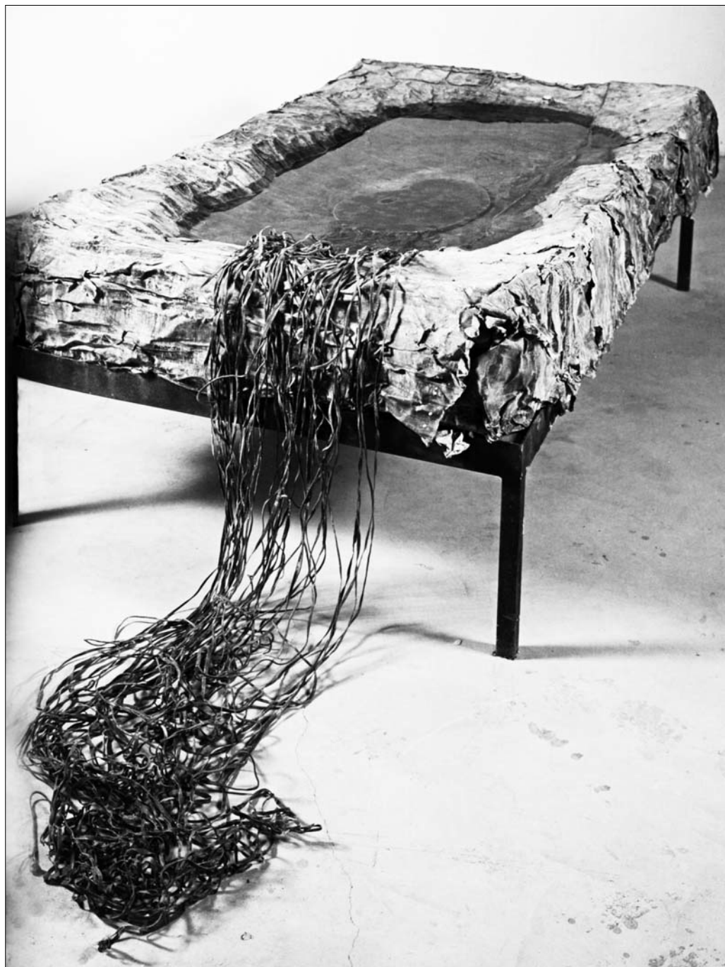
Ансельм Кифер. Вероника. 1992