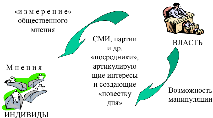
Рис. 3. Общественное мнение в «массовом обществе» («количественная модель»)

Какими видятся последствия этих изменений? В западной литературе высказываются различные точки зрения на сей счет. «Пессимисты» полагают, что произошедшие перемены фатальны, «качественное» общественное мнение навсегда ушло в прошлое, и «массовое» общество обречено быть объектом манипуляции, что делает неизбежным пересмотр прежних нормативных представлений о демократии. «Оптимисты» ищут пути к возрождению публичной сферы на новой институциональной основе, пытаясь критиковать опыт наличных демократий, дабы стимулировать их развитие (теория коммуникативного действия Ю.Хабермаса, концепции делиберативной демократии и др.). Наконец, некоторые авторы (Дж.Б.Томпсон, С.Холл, Дж.Саймонс и др.) предлагают отказаться от категорических оценок и увидеть «критический потенциал», заключенный в общественном мнении даже в его нынешнем «количественном» состоянии. Они указывают, что пассивность людей и возможности манипуляции общественным мнением сильно преувеличены, ибо процессы восприятия образов и посланий предполагают момент интерпретации и к тому же происходят в перенасыщенной информационной среде, которую трудно контролировать. Однако и эти авторы согласны с тем, что приговор «качественному» общественному мнению является окончательным, с медиатизацией политики формирование мнений посредством личного участия осталось в прошлом. А это меняет природу публичности и способы участия в публичной жизни. Благодаря телевидению, Интернету