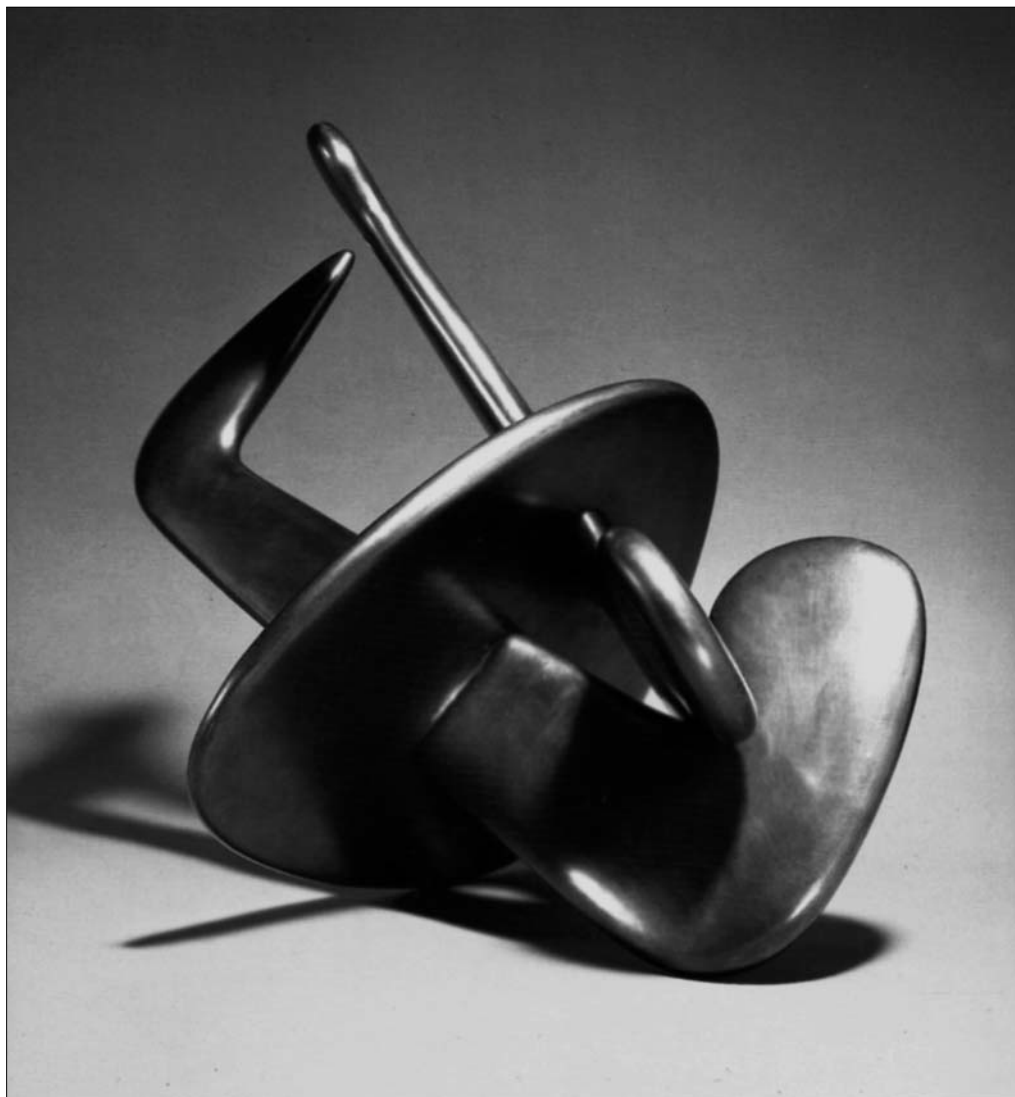
Исаму Ногучи. Семя. 1946

наиболее профпригодных его функционеров. И потому закономерно, что высшие органы руководства СССР — политбюро и ЦК КПСС — со временем превратились в «клуб геронтократов»*. Отстранив от власти в 1964 году Хрущева, партийно-государственная бюрократия осознала себя полновластной хозяйкой страны, получив все необходимое для комфортного существования и пока еще скрытного обогащения.