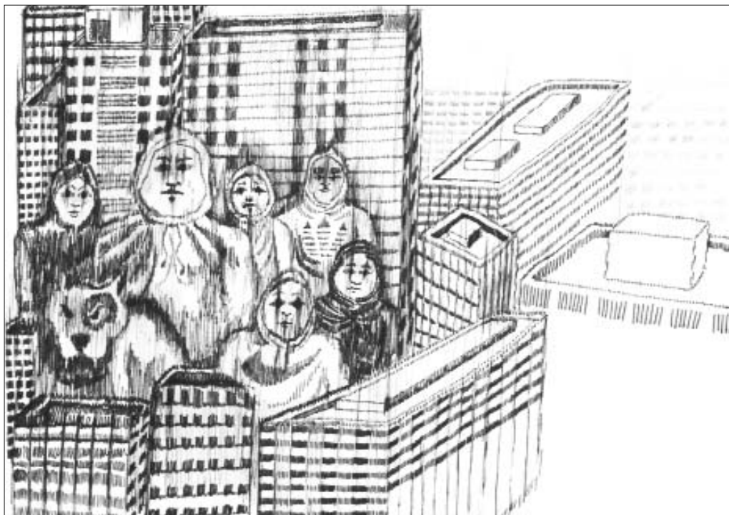
Кадер Аттия. Без названия. 2006

стенах высшей школы студенты должны получать не только актуальные знания для решения технических проблем.