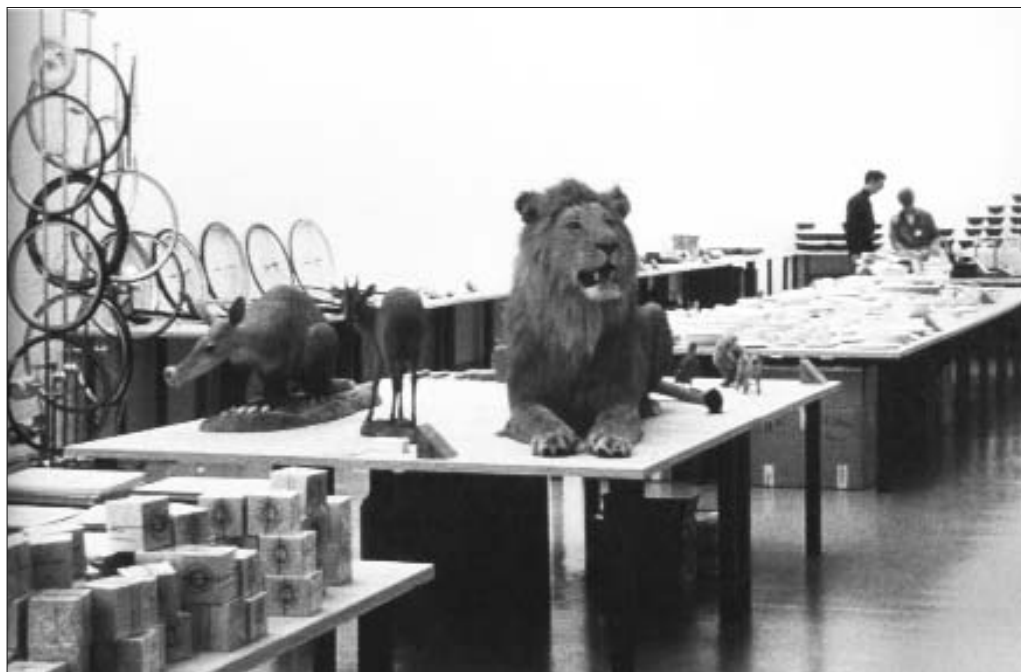
Фабрис Ибер. Ибермаркет. 1995