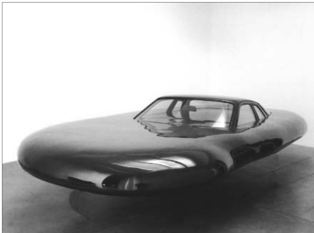
Эрвин Вурм. НЛО. 2006

развития? Малочисленные образованные группы российского общества создали величайшую культуру, всемирно признанную русскую литературу. Однако это оказалось отнюдь не тождественно освоению этой же культуры многомиллионным народом России. И потому закономерно, что выдающаяся отечественная гуманистическая литература XIX века не оказала существенного гуманизирующего влияния на российский XX век.