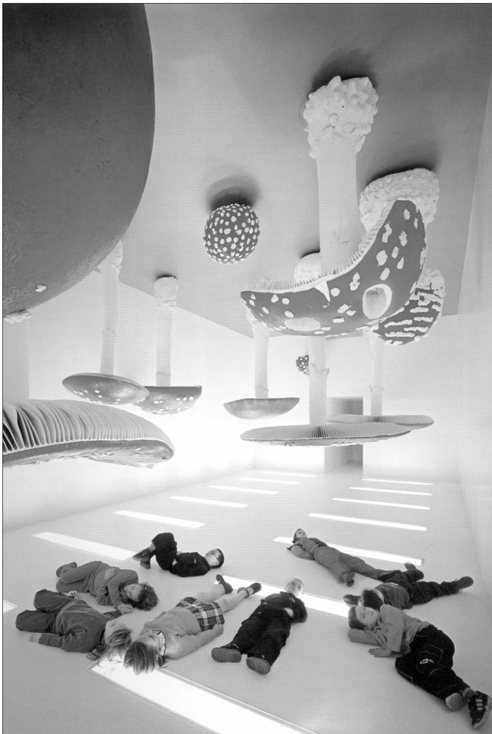
Карстен Хеллер. Перевернутая грибная комната. 2000