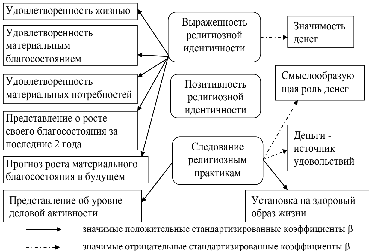
Рисунок 2. Взаимосвязь характеристик религиозной идентичности с экономическими установками (студенты-мусульмане)

доверием, что, в целом, способствует экономическому развитию. Выраженность религиозной идентичности у студентов-мусульман в целом взаимосвязана с продуктивными экономическими установками и представлениями: прогнозом роста своего благосостояния в будущем, удовлетворенностью потребительских интересов, удовлетворенностью материальным благосостоянием, удовлетворенностью жизнью и установкой на здоровый образ жизни (см. рис. 2).