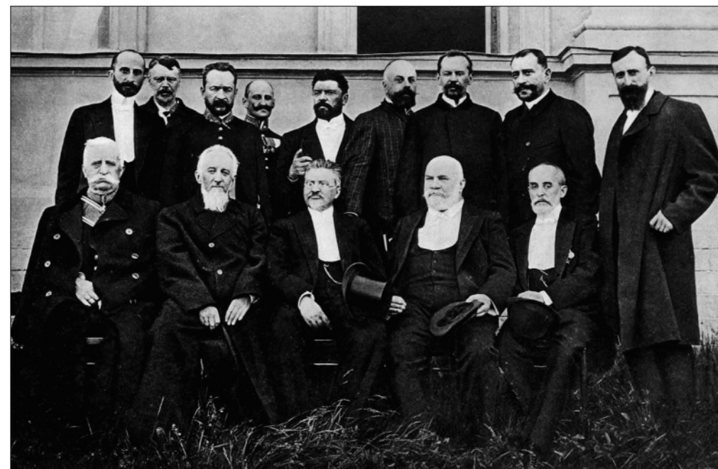
Депутация земских и городских деятелей, принятая императором Николаем II 6.07.1905 г. в Петергофском дворце.

Стоят (слева направо): Н.Н. Львов, Ф.И. Родичев, Г.Е. Львов, Ф.А. Головин, Н.Н. Ковалевский, П.Д. Долгоруков, С.Н. Трубецкой, Ю.А. Новосильцев, Д.И. Шаховской. Сидят (слева направо): П.Л. Корф, П.А. Гейден, И.И. Петрункевич, М.П. Федоров, А.Н. Никитин