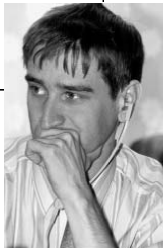
Владим Бондарь, депутат Государственной Думы России

Спор сторонников разных моделей начинался в России, и это естественно, с поисков его базового определения. С точки зрения власти , местное самоуправление — это уровень публичной власти, куда передаются сверху многие полномочия для большей эффективности и оптимизации общегосударственной системы управления. Но даже хорошая система управления — не всегда самоуправление. С точки зрения людей , местное самоуправление — это право объединяться для совместного решения своих проблем по месту жительства. Право посадить цветы, найти хороших учителей, выбрать честного участкового и так далее. (Конечно, право — это не обязанность. Можно продолжать жить в грязи, бояться хулиганов и ругать за все это,