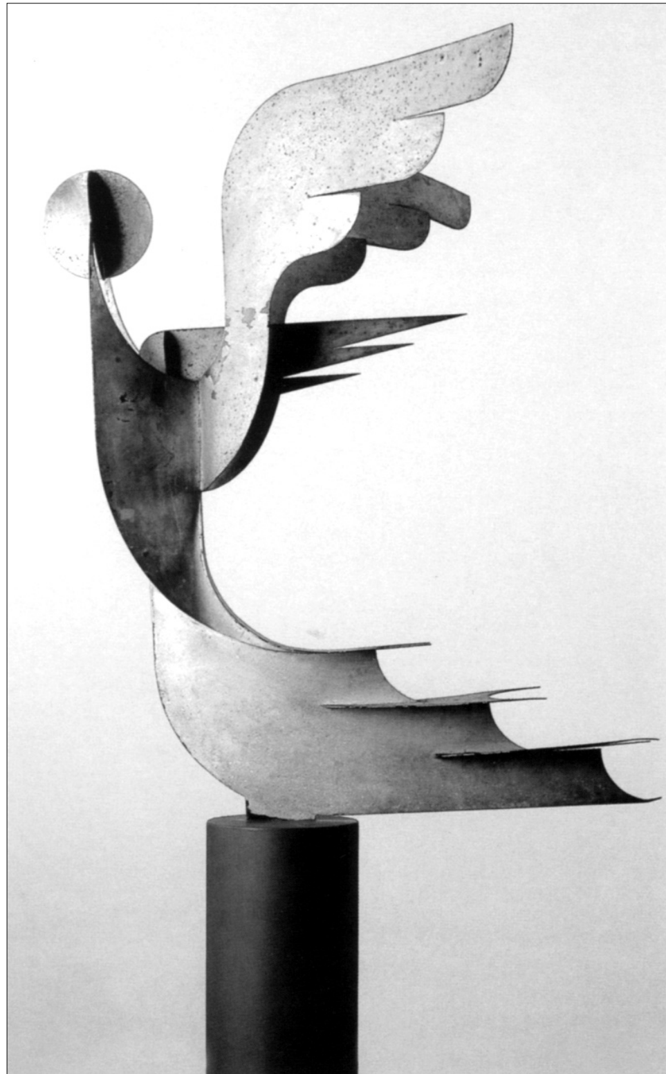
Тайат (Эрнесто Микагеллес). Победа воздуха. 1931

бодная или зависимая, чтобы стать фактом материальной жизни, должна быть как-то упакована и распространена. Это и есть инфраструктура свободы слова, инструмент ее фиксации и распространения. Если пользоваться единственным источником, остается в него свято верить, хотя могут быть и другие взгляды на ту же проблему.