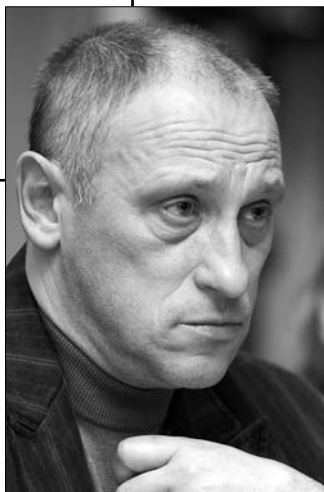
Александр Лузан, президент Института национального проекта “Общественный договор”