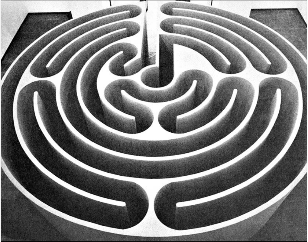
Роберт Моррис. Лабиринт. 1974

ны приходят к горизонтальному контракту. Все гораздо сложнее. Увы, в мире не происходит такого мощного процесса, который ведет к горизонтальному контракту и демократическому устройству. Почему? Ответ можно получить, рассуждая не в терминах «люблю — не люблю демократию», а в терминах общественного договора. Именно он позволяет говорить о спросе, предложении, об издержках, о выгодах тех или иных групп людей, не говоря уже о характере распределения общественных благ. То есть, другими словами, спрос обычно возникает на ту или другую структуру государства. Например, скандинавские страны явно отличаются по содержанию общественного договора от Франции и Гер-