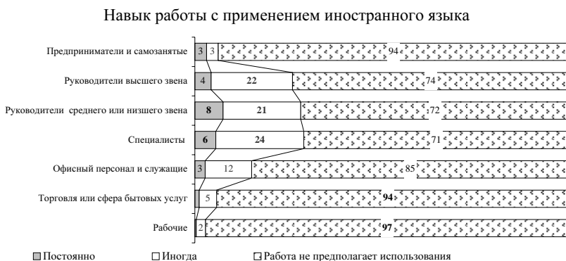
Рис. 4. Навыки, которые представители различных социально-профессиональных групп используют в своей работе, % от работающих их представителей

Вместе с тем сравнение форм пополнения знаний, используемых разными группами работников, позволяет говорить о явном различии причин обновления ими своего человеческого капитала. У руководителей и служащих это связано, как правило, с доведением уже имеющейся квалификации «до ума», в то время как специалисты рассматривают процесс обновления человеческого капитала с точки зрения расширения границ уже имеющейся квалификации [Аникин, 2010а]. Это принципиальное отличие позволяет нам глубже оценить объективные предпосылки модернизации, которые, хотя и существуют, но сосредоточены