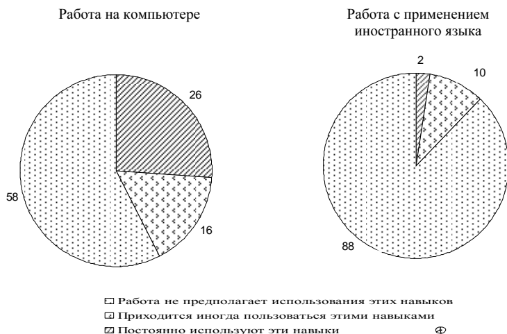
Рис. 2. Навыки, которые россияне используют в своей работе, % от работающих

сти, например, навык работы на компьютере. Учитывая, что информационные технологии являются сегодня основой мирового экономического развития, данные, представленные на рис. 2–4, позволяют говорить как минимум о потенциальной неспособности к полноценному участию российских работников в международном разделении труда. Так, видно, что работа большей части россиян (58%) не предполагает использования навыков работы на компьютере, не говоря уж о навыках работы с применением иностранного языка или совместном использовании этих компетенций.