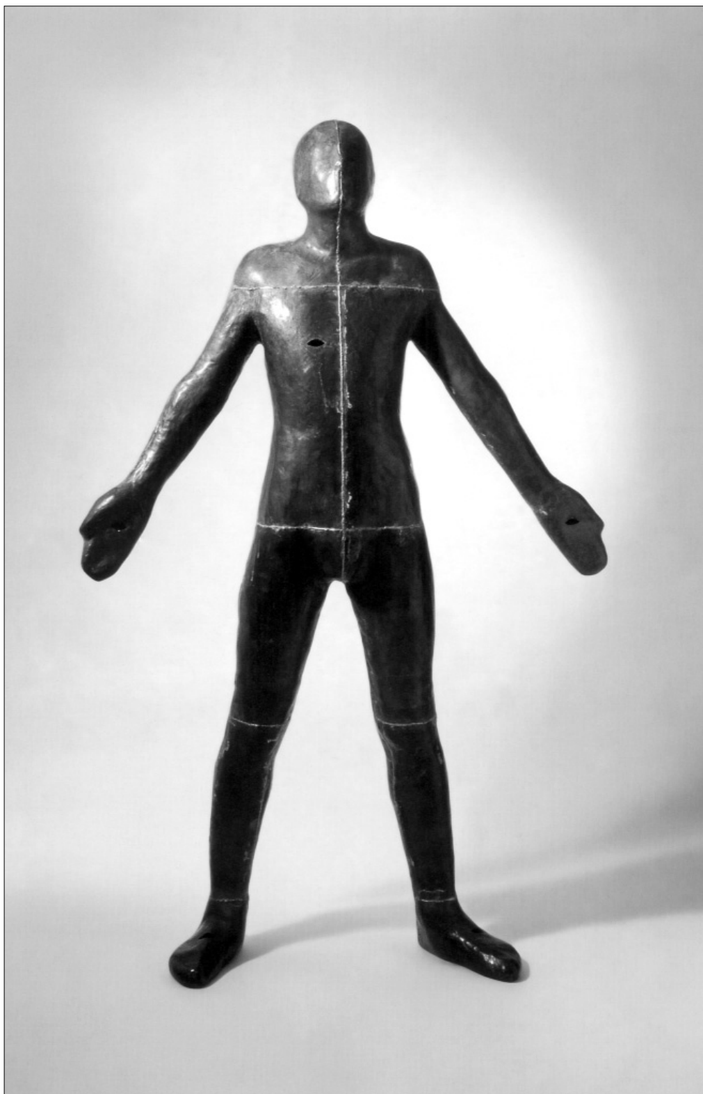
Энтони Гормлей. Без названия. 1986

Наша судебная власть построена по тому же принципу, что и власть исполнительная, — это вертикаль. Судей у нас утверждает президент, но в представлении ему кандидатур и продлении судейского статуса после испытательного срока большую роль играет местная исполнительная власть и председатели судов. Судья очень сильно зависит от председателя суда — в его руках организационные и финансовые рычаги. Председатель распределяет, какие дела судья будет вести, его роль решающая при распределении всех благ: квартиры, награды, повышение в должности, поездки за рубеж и в столицу. Более того, роль председателя является решающей в сохранении судьей его статуса или лишении его. Формально отстраняет судью от должности квалификационная коллегия, состоящая в основном из судей. Вроде бы очень демократический принцип. Но поскольку судьи зависят от председателя, то чаще всего они принимают решение, угодное председателю.