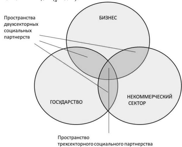
Рис. 1. Пространство трехсекторного социального партнерства

Наиболее удачное схематичное отображение межсекторного социального партнерства, которое отражает и специфику действий и взаимодействий в системе социальной защиты населения, представлено В. Н. Якимцом (рис. 1).